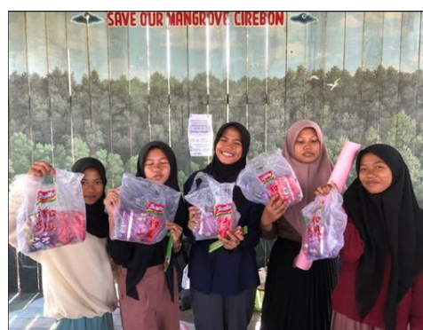
Gambar-4 Pemberian Hadiah kepada peserta yang aktif

Sesi terakhir dari kegiatan Pengabdian kepada Masyarakat (PkM) tim PPK Ormawa UCIC ini adalah tahap evaluasi (sesi tanya jawab). Para peserta kegiatan PkM PPK Ormawa cukup antusias mengajukan pertanyaan tentang komunikasi yang efektif. Peserta yang aktif dalam sesi tanya jawab ini diberikan hadiah oleh panitia.