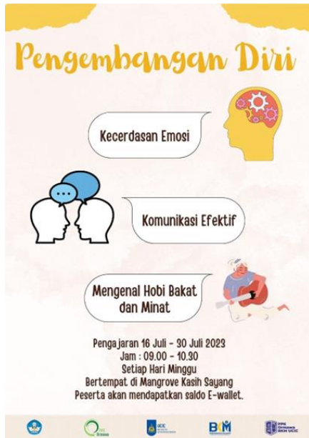
Gambar-2 Poster Pelaksanaan Kegiatan Literasi Pengembangan Diri tim PPK Ormawa BKM UCIC