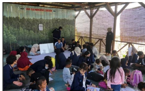
Gambar-4 Dokumentasi Kegiatan Pelatihan Soskill Komunikasi di Desa Mundu Pesisir

berkomunikasi dengan baik sangat penting untuk mencapai tujuan dan menjaga interaksi yang positif (Fitriyanti et al., 2022).