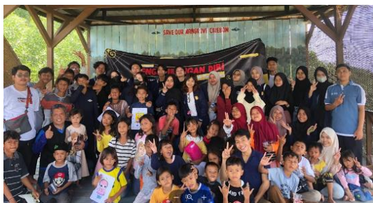
Gambar-5 Foto Bersama Kegiatan Tim PPK Ormawa BKM UCIC Cirebon di Wisata Hutan Mangrove Kasih Sayang di Desa Mundu Pesisir Cirebon