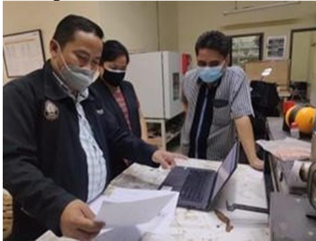
Gambar-2 Tim kegiatan PkM Internasional

Tim pengabdian masyarakat melakukan pertemuan awal dengan pihak SRC Holand untuk memahami secara mendalam kebutuhan dan tujuan dari sosialisasi ini. Dalam pertemuan ini membahas pemahaman tentang klien mereka, kendala yang dihadapi, dan bagaimana video konferensi dapat membantu memperbaiki proses pendampingan dan pembuatan alat bantu gerak.