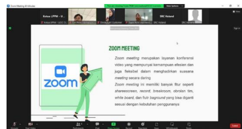
Gambar-5 Pelaksanaan Sosialisasi Penggunaan Zoom Meeting Bersama SRC Holland