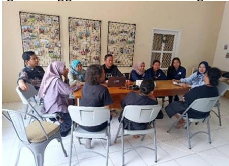
Gambar-3 Tim kegiatan PkM Internasional

Berdasarkan identifikasi kebutuhan, tim pengabdian masyarakat Universitas Catur Insan Cendekia (UCIC) selanjutnya menyusun materi sosialisasi yang mencakup pengenalan teknologi video conference dengan menggunakan zoom meeting, aplikasi praktis dalam pembuatan alat bantu gerak, panduan penggunaan, dan demonstrasi langsung tentang cara menggunakan platform video conference dengan menggunakan zoom meeting.