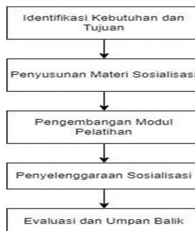
Gambar-1 Metode Pelaksanaan Kegiatan PkM Internasional UCIC dengan SRC Holland

Metode kegiatan PkM Internasional yang digunakan dapat terlihat dalam Gambar-1 berikut ini: