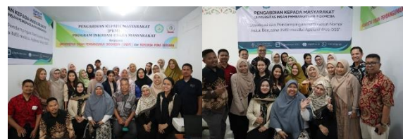
Gambar 2 Dokumentasi Kegiatan PkM

Pelaksanaan inkubasi selama 4 bulan dari mulai September sampai dengan Desember 2024 yang dilakukans setiap hari Sabtu di ruang Bum Desa Pema Bersama. Kegiatan ini dilakukan atas dasar kepedulian Bum Desa Pema Bersama dalam meningkatkan ekonomi melalui usaha masyarakat mulai dari usaha furniture dari bambu, kuliner sampai dengan usaha kreatif lainnya.