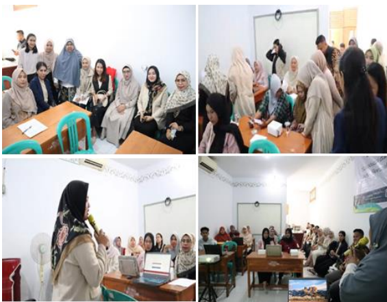
Gambar 3 Dokumentasi Kegiatan PkM

Narasumber pertama menyampaikan mengenai pengertian NIB, manfaat, fungsi, dan persyaratan yang harus dibawa oleh pelaku usaha untuk membuat NIB. Narasumber pertama menyampaikan juga mengenai bahwa pelaku usaha harus memiliki NIB agar usaha menjadi lancar dan percaya diri. NIB seperti halnya seseorang memiliki KTP sebagai identitas diri sebagai warga negara Indonesia. KTP juga seperti SIM yang harus dimiliki oleh seseorang yang memiliki kendaraan bermotor